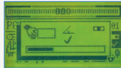
De automatische kalibratie bepaalt snel de productinstellingen