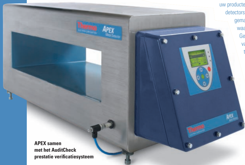
APEX samen met het AuditCheck prestatie verificatiesysteem

In de actuele concurrerende markten dienen voedingsmiddelenproducten op tijd te worden geleverd en tegen een concurrerende prijs. De veiligheid van de voedingsmiddelen mag niet in gevaar komen, daarom zijn metaaldetectoren een integraal onderdeel van een HACCP-programma. De sleutel voor het beschermen van uw producten is het gebruik van beschikbare robuuste detectors die een hoge prestatie kunnen leveren en gemakkelijk in gebruik zijn. Dit zijn de gebieden waarin APEX een nieuwe standaard zet. Gezien de jarenlange ervaring op het gebied van metaaldetectie-ontwikkeling en toepassing heeft Thermo de meest gevoelige, maar toch gemakkelijk te bedienen metaaldetector ter wereld ontwikkeld. Met APEX in uw productielijn kunt u snel en volledig uw kwaliteitsdoelstellingen vervullen, kostbare productieapparatuur verder in de lijn beschermen en er zeker van zijn dat uw productleveringen geen ongewenste metalen verontreinigingen bevatten.