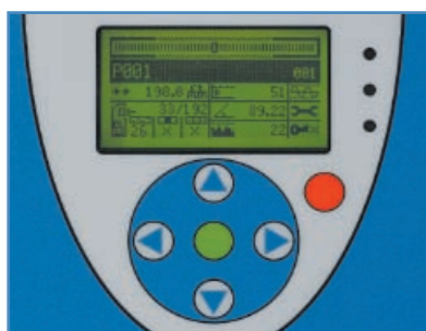
Gemakkelijk te gebruiken touch-panel bedieningspaneel

Door gebruik te maken van succesvolle ontwerpconcepten, toegepast in vele consumentenproducten zoals mobiele telefoons en computers, is de APEX gebruikersinterface universeel begrijpelijk omdat het gebaseerd is op pictogrammen en niet op complexe technische termen. Om het gebruik te vergemakkelijken kan een meertalige helptekst worden opgeroepen voor meer informatie. Achter de navigatieknoppen is gebruik gemaakt van een duurzaam circuit voor het touch-panel, dus u hoeft zich geen zorgen te maken over de kwetsbaarheid van het toetsenbord, schade tijdens het reinigen of misbruik. Het volledig geïntegreerde bedieningspaneel is gemaakt van ABS kunststof voor zware omstandigheden en waarin geen deuken kunnen komen en niet kan vervormen, zoals bij metalen bedieningspanelen het geval is. Lichte beschadigingen aan metalen bedieningspanelen kunnen resulteren in waterlekages en elektronische defecten.